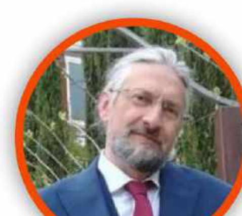
MASSIMO TAVOLA SECONDARIA DI PRIMO GRADO