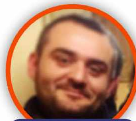
ROBERTO ZOLLO SCUOLA PRIMARIA