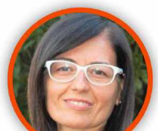
MARIE ANNA FEBBRAIO SECONDARIA DI PRIMO GRADO